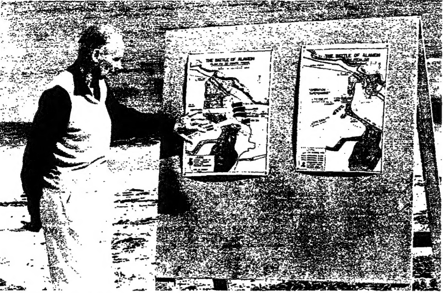
القائد مارشال مونتغمري يشير الى خريطة معركة المثلين، ولقائدهما زيارته لمنطقة المعركة عام ١٩٦٧ قبل بضعة سنوات من وفاته

والعريف أن القائد مارشال مونتغمري كان قائد قوات الحلفاء في معركة المثلين، ويوجهه على الجانب الآخر المرشال روميل قائد القوات الألمانية النازية.